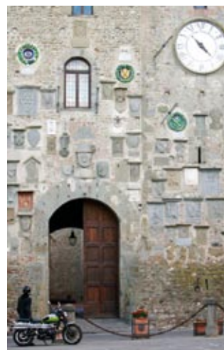
Scarperia, Palazzo Pretorio