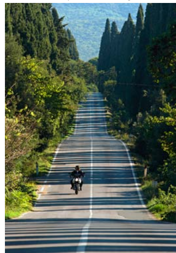
Viale di cipressi a Bolgheri