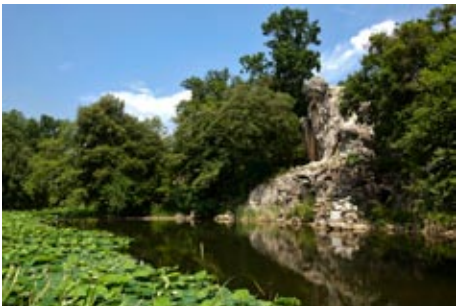
Villa Demidoff, Colosso Appennino