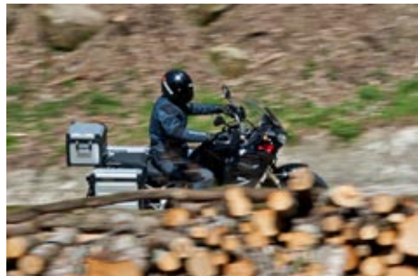
Lungo la Panoramica dei Colli Alti