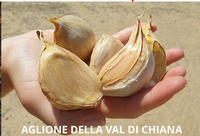
AGLIONE DELLA VAL DI CHIANA