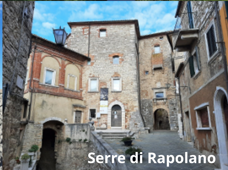
Serre di Rapolano