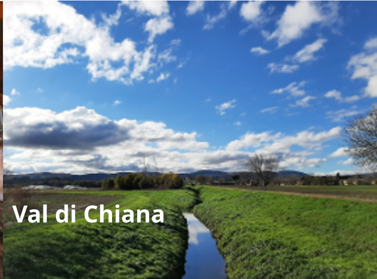
Val di Chiana