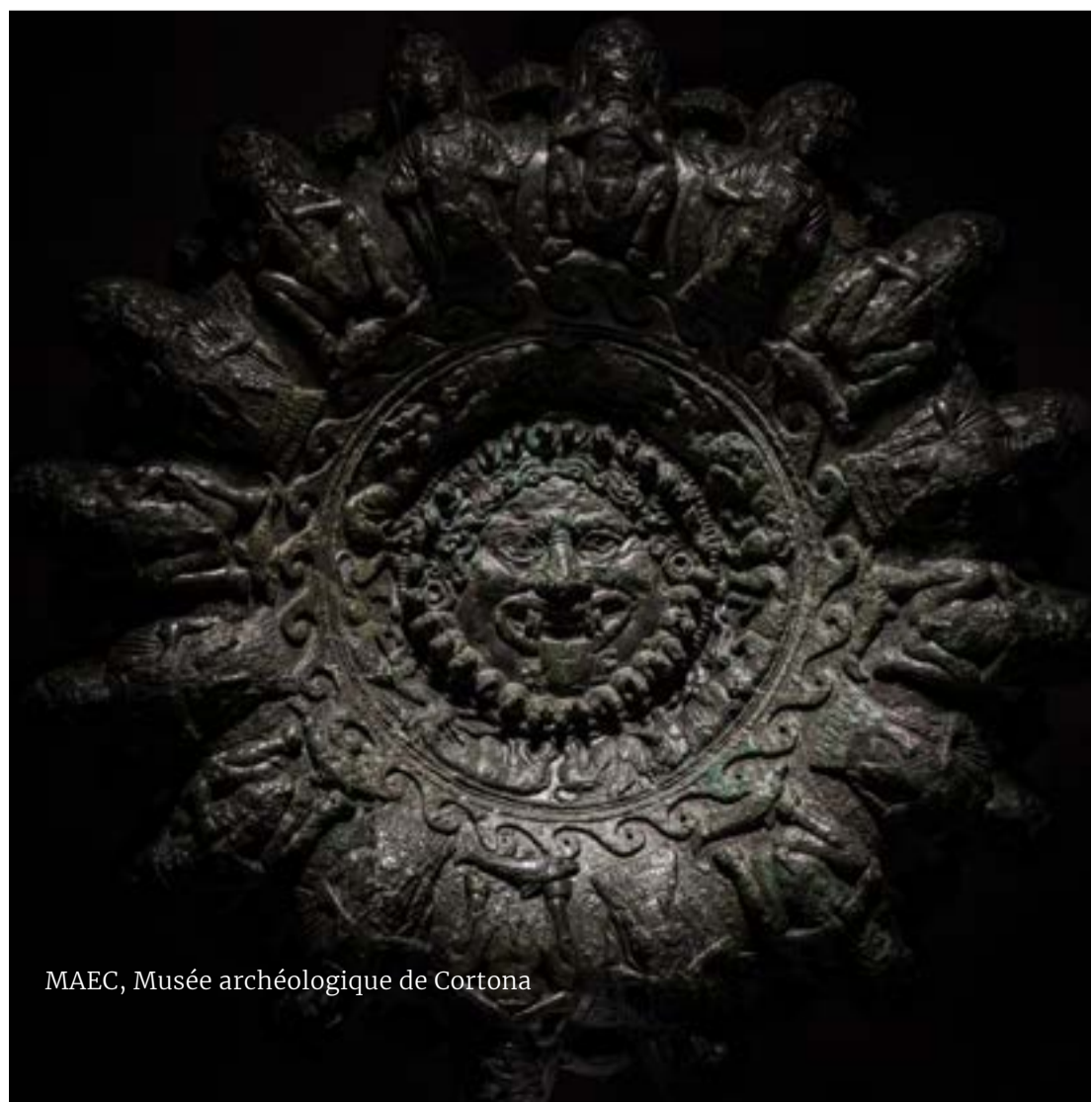
MAEC, Musée archéologique de Cortona