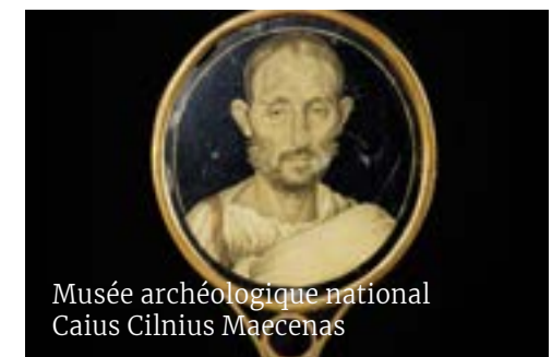
Musée archéologique national Caius Cilnius Maecenas

Les thermes romains de Néron du I er siècle ap. J.-C. sont situés au cœur de Pise. Alimentés par l'aqueduc romain du I er siècle de Caldaccoli, leur nom évoque le célèbre empereur romain mais les thermes ont été construits une vingtaine d'années après sa mort. Ils seraient inspirés de l'histoire de Saint Torpé, un officier de la cour de Néron qui, après avoir été converti au christianisme, fut arrêté et décapité ici. Le musée naval, avec une magnifique collection de navires romains est également intéressant. navidipisa.it