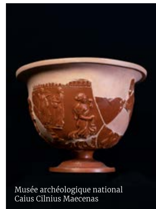
Musée archéologique national Caius Cilnius Maecenas

Les îles de l'archipel toscan appartenaient à la famille de l'empereur Néron au I er siècle de notre ère. Deux villas résidentielles ont été édifiées sur les îles du Giglio et de Giannutri. La première était attenante au port du Giglio et a été utilisée comme nécropole au IV e siècle après. J.-C. La seconde est tombée en désuétude au III e siècle après J.-C. et risquait de disparaître, mais grâce à des fouilles archéologiques au XIX e siècle, elle est revenue à la lumière et a été rendue au public en 2015. museiarcipelago.it