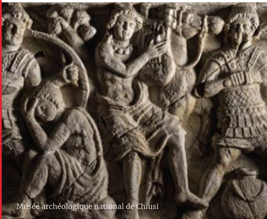
Musée archéologique national de Chiusi

en utilisant des onguents et en pratiquant des activités physiques. Leur religion se basait sur des superstitions qui devenaient une pratique quotidienne célébrée avec une attention maniaque pour les détails. Le conflit entre les cités étrusques et Rome devint inévitable après des années de civilisation florissante et, à partir du Ve siècle avant J.-C., le processus de romanisation de l'Étrurie commence: d'abord de façon indolore, avec la reddition spontanée de plusieurs cités tombées sous l'influence du puissant voisin, puis plus coercitivement, au Ier siècle avant J.-C., en brisant même la résistance des Gaulois alliés aux Étrusques. Si Rome s'est imposée sur les terres étrusques, il n'en a pas été de même pour la culture, qui est toujours restée marquée dans les substrats et les modèles artistiques préexistants, enracinés dans la population, dont l'origine étrusque ne fait aucun doute.