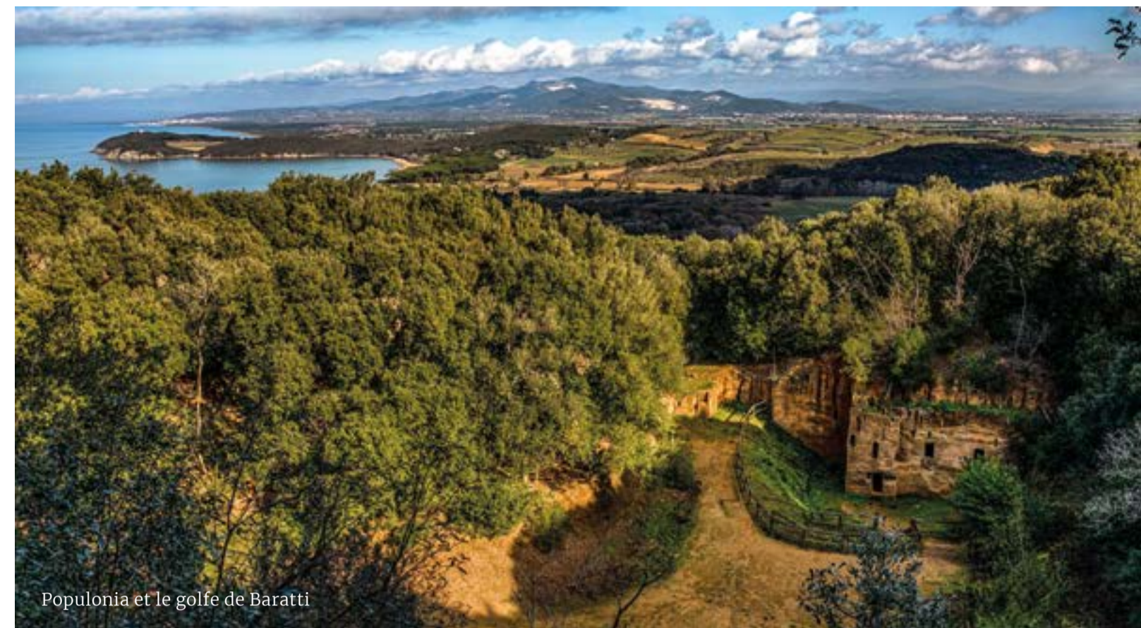
Populonia et le golfe de Baratti