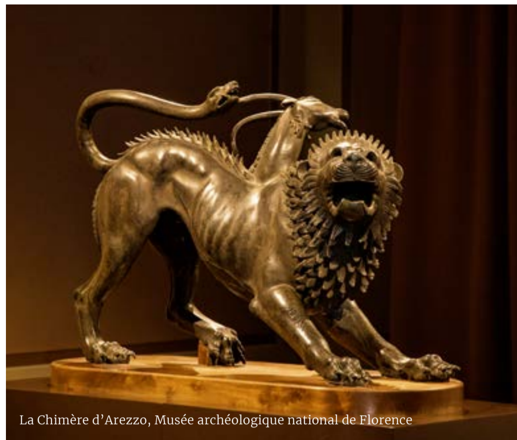
La Chimère d'Arezzo, Musée archéologique national de Florence

Volterra, ville étrusque par excellence, permet de découvrir cette civilisation avec ses sites archéologiques et son musée. Le trajet débute par les remparts, érigés au III e siècle av. J.-C. pour protéger la ville. Les murailles étaient à l'origine de 7 km de long, dont certaines parties sont encore accessibles aujourd'hui. La Porta All'Arco au sud et la Porta Diana au nord sont les deux portes principales. Le Musée Guarnacci abrite une collection d'urnes funéraires et la statue Ombre du soir.