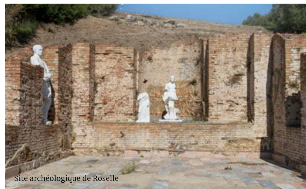
Site archéologique de Roselle

La colonie romaine de Cosa a été créée après la victoire des Romains sur les Etrusques de Vulci et la conquête du territoire en 273 avant J.-C. La colonie se compose de trois zones, deux quartiers publics et un quartier résidentiel: il est encore possible de se promener dans les anciennes rues, en admirant les vestiges des maisons et des boutiques du forum. Des ruines de bâtiments plus anciens sont présentes dans le parc, ce qui suggère que Cosa était un avant-poste byzantin contre l'avancée des Lombards. museidimaremma.it