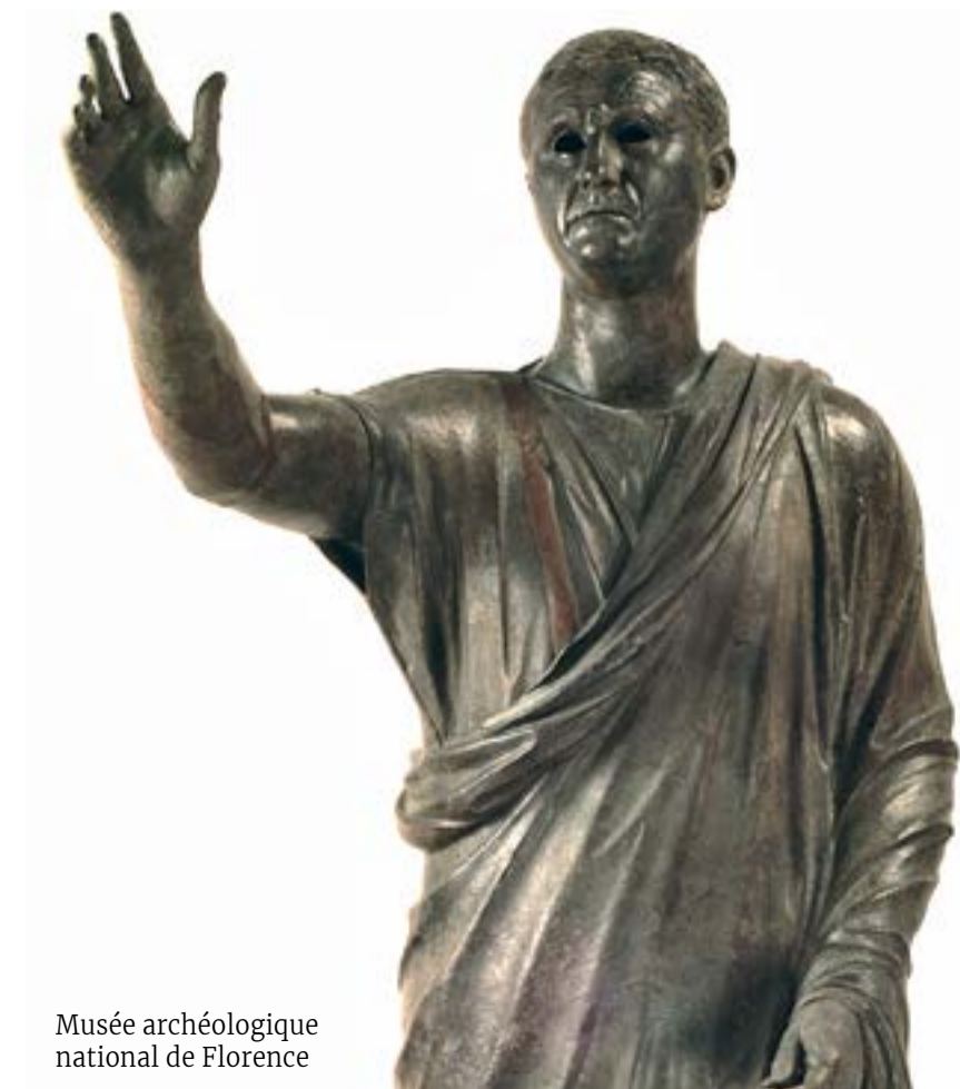
Musée archéologique national de Florence

Le musée est en relation étroite avec le parc naturel archéologique de Belverde. Certaines des grottes s'ouvrant dans le travertin, éclairées et équipées, sont accessibles à la visite, telles que la grotte de San Francesco, les antres de la Noce et du Poggetto. Situé à proximité de la zone archéologique du même nom, l'Archéodrome de Belverde est un parcours pédagogique qui complète la visite du musée et du parc. preistoriacetona.it