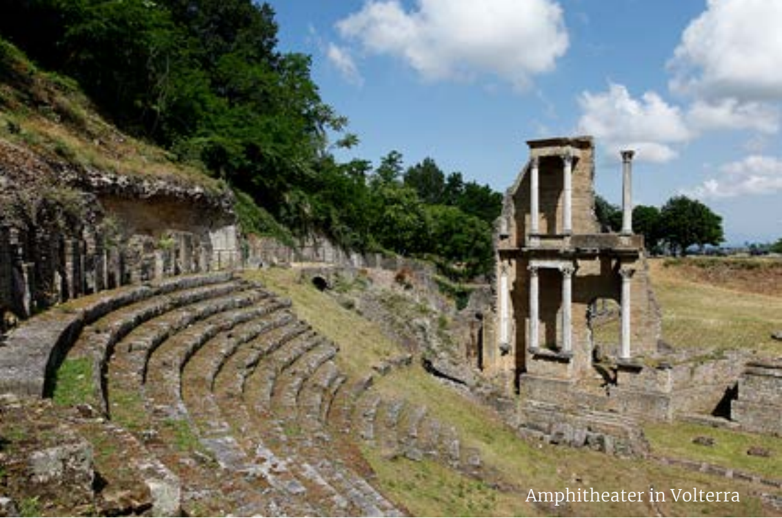
Amphitheater in Volterra

TOSKANA EINE RENAISSANCE, DIE NIEMALS ENDET