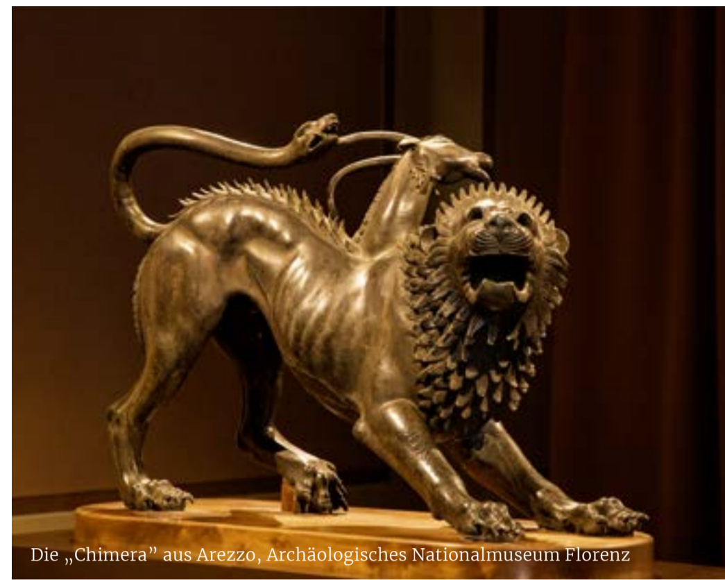
Die „Chimera“ aus Arezzo, Archäologisches Nationalmuseum Florenz

Volterra ist die etruskische Stadt schlechthin und ermöglicht es, diese Zivilisation dank ihrer archäologischen Fundstätten und des etruskischen Museums zu erkunden. Der Rundweg beginnt bei den Mauern, die im 3. Jahrhundert v. Chr. zur Verteidigung der Stadt errichtet wurden. Am Anfang erstreckten sich die Stadtmauern über 7 Kilometer, und einige Abschnitte davon sind heute noch begehbar. Die zwei Haupttore sind die Porta all'Arco im Süden und die Porta Diana im Norden. Das Museo Guarnacci beherbergt eine Sammlung von Graburnen und die Statue „Ombra della sera“.