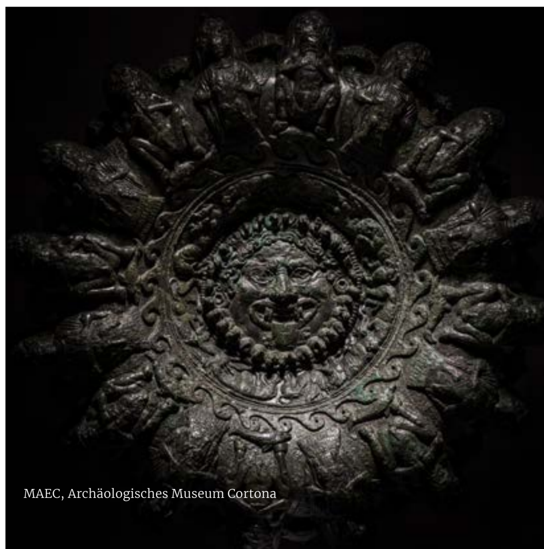
MAEC, Archäologisches Museum Cortona