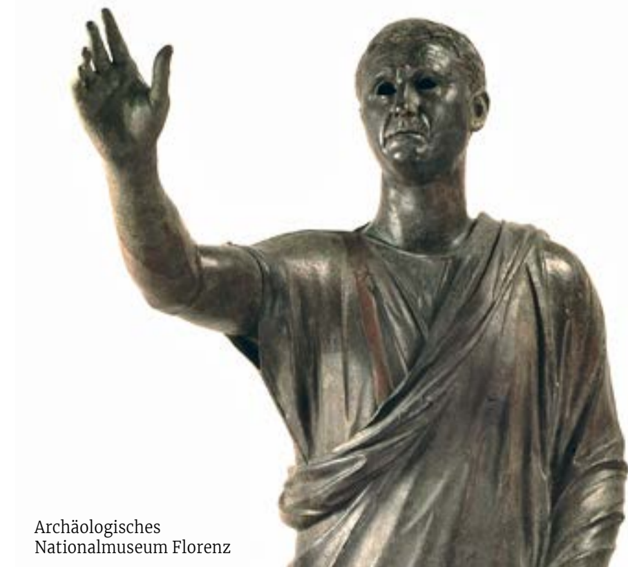
Archäologisches Nationalmuseum Florenz

Das Museum dokumentiert die Besiedelung, die das Gebiet des Monte Cetona ab dem Paläolithikum bis zur Bronzezeit gekennzeichnet hat, durch die Ausstellung von Fundstücken und Rekonstruktionen. Eng mit dem Museum verbunden ist der Parco Archeologico Naturalistico von Belvedere , in dem einige der Höhlen besichtigt werden können, die sich im Travertin auftun und die entsprechend beleuchtet und ausgestattet sind, wie die Grotte von San Francesco und die Höhlen von Noce und Poggetto. Das Archeodromo von Belvedere , das sich unweit des gleichnamigen Archäologieareals befindet, ist ein Lehrpfad, der den Besuch des Museums und des Parks ergänzt. preistoriacetona.it