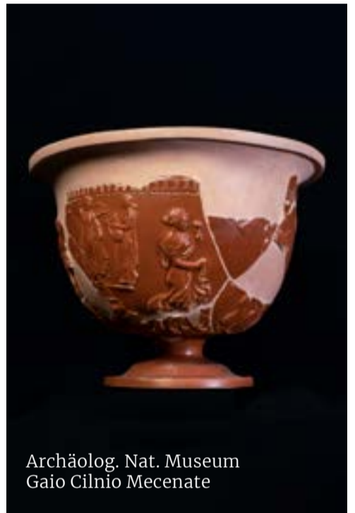
Archäolog. Nat. Museum Gaio Cilnio Mecenate

Während des 1. Jahrhunderts n. Chr. war die Familie von Kaiser Nero Eigentümerin der Inseln des toskanischen Archipels. Auf der Isola del Giglio und der Isola di Giannutri wurden zwei Villen gebaut. Die erste mit Blick auf den Hafen der Isola del Giglio. Im 4. Jahrhundert n. Chr. wurde sie als Nekropole genutzt. Letztere wurde im 3. Jahrhundert n. Chr. aufgegeben und wäre beinahe in Vergessenheit geraten, doch dank der Ausgrabungen, die im 19. Jahrhundert durchgeführt wurden, kam sie wieder ans Licht und wurde 2015 für die Öffentlichkeit zugänglich gemacht. museiarcipelago.it