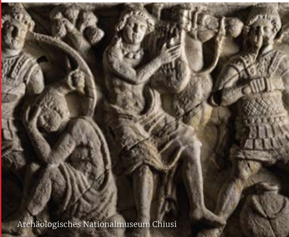
Archäologisches Nationalmuseum Chiusi

Sie waren elegant und raffiniert, pflegten ihren Geist, aber auch ihren Körper, mit Salben und körperlicher Betätigung; sie hatten eine aus Aberglauben bestehende Religiosität, die zu einer täglichen Praxis wurde, die sie mit extremer Liebe zum Detail zelebrierten. Nach Jahren blühender Zivilisation wurde der Konflikt zwischen den etruskischen Städten und Rom unausweichlich, und ab dem 5. Jahrhundert v. Chr. begann der Prozess der Romanisierung Etruriens : zunächst schmerzlos, mit der spontanen Kapitulation mehrerer Städte, die unter den Einfluss des mächtigen Nachbarn überwechselten, dann zwingender, im 1. Jahrhundert v. Chr., indem sogar der Widerstand der mit den Etruskern verbündeten Gallier gebrochen wurde. Und wenn Rom seine Herrschaft in den etruskischen Gebieten durchsetzte, so kann man von der Kultur nicht das gleiche sagen, die immer von den bereits vorhandenen künstlerischen Substraten und Modellen durchzogen wird, die in der Bevölkerung verwurzelt und zweifellos etruskischen Ursprungs waren.