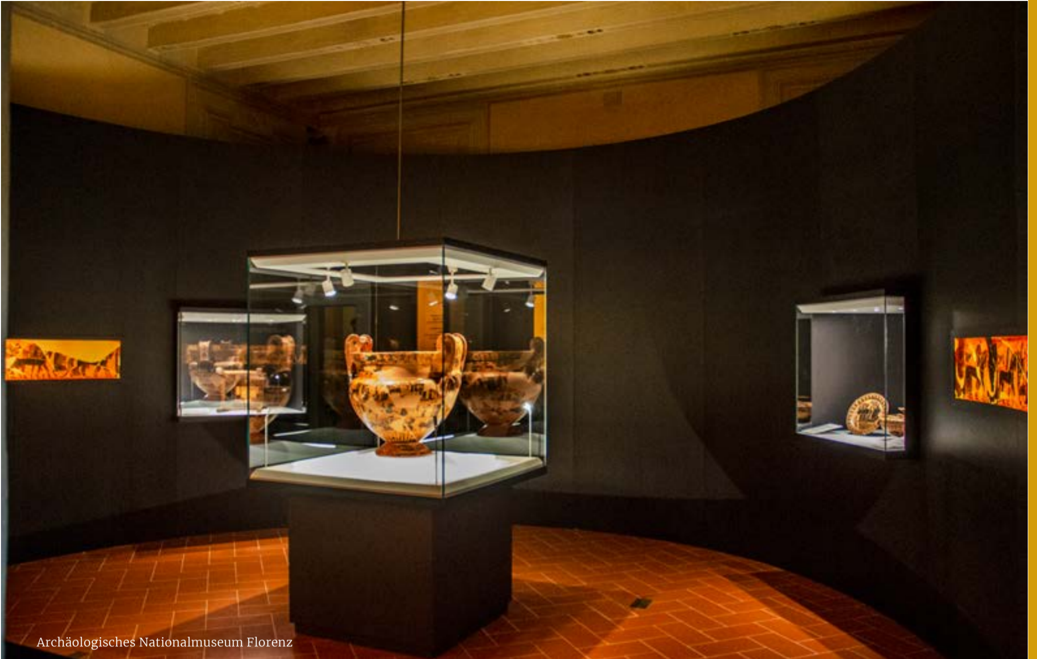
Archäologisches Nationalmuseum Florenz