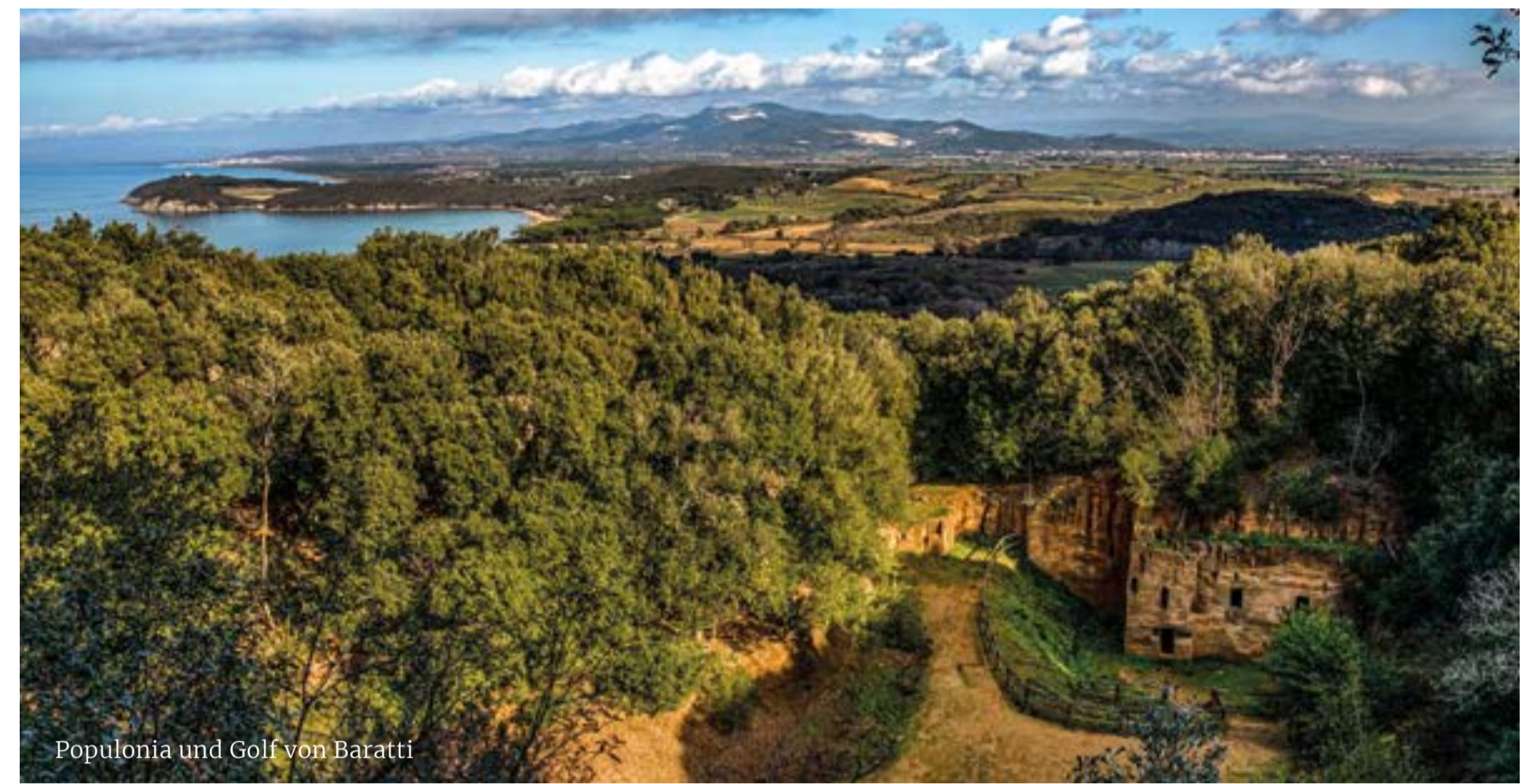
Populonia und Golf von Baratti

Im Herzen von Pisa befinden sich die Nero-Thermen, ein römisches Bad aus dem 1. Jahrhundert n. Chr., das vom römischen Aquädukt von Caldaccioli aus dem 1. Jahrhundert versorgt wurde. Der Name könnte auf den bekannten römischen Kaiser verweisen, der Bau der Thermen begann jedoch etwa zwanzig Jahre nach seinem Tod. Er ist auf die Legende von San Torpè zurückzuführen, einem Offizier am Hofe Neros, der sich zum Christentum bekehrt hatte, verhaftet und hier geköpft wurde. Interessant ist auch das Schifffahrtsmuseum, das eine wunderschöne Sammlung römischer Schiffe beherbergt. navidipisa.it