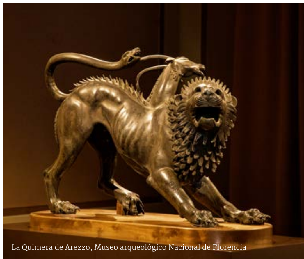
La Quimera de Arezzo, Museo arqueológico Nacional de Florencia

Volterra Volterra es la ciudad etrusca por excelencia. Descubre esta civilización a través de sus yacimientos arqueológicos y visita el museo etrusco. Construidas en el siglo III a.C., las murallas se extendían inicialmente a lo largo de 7 km. Hoy en día, hay algunas partes que se conservan y se pueden recorrer. La Porta all'Arco, al sur, y la Porta Diana, al norte, son las dos puertas principales. El Museo Guarnacci alberga un colección de urnas funerarias y la estatua Sombra de la noche. museoetrusco.it