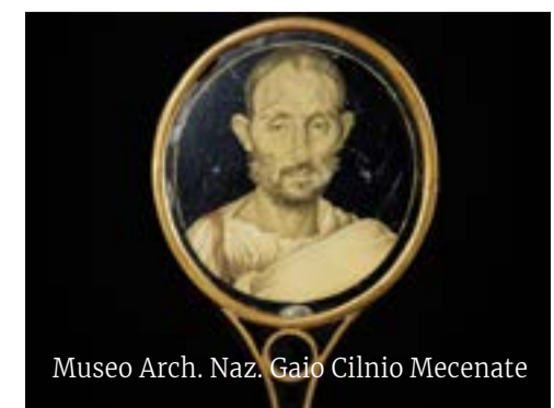
Museo Arch. Naz. Gaio Cilnio Mecenate

En el corazón de Pisa se encuentran las Termas de Nerón, un baño romano del siglo I d.C. alimentado por el acueducto romano de Caldaccoli , del siglo I. El nombre podría hacer pensar en el famoso emperador romano, pero la construcción de las termas comenzó unos veinte años después de su muerte. Su origen se remonta a la leyenda de San Torpé, un funcionario de la corte de Nerón que, tras convertirse al cristianismo, fue arrestado y decapitado en este lugar. También es interesante el museo naval, que alberga una bella colección de barcos romanos. navidipisa.it