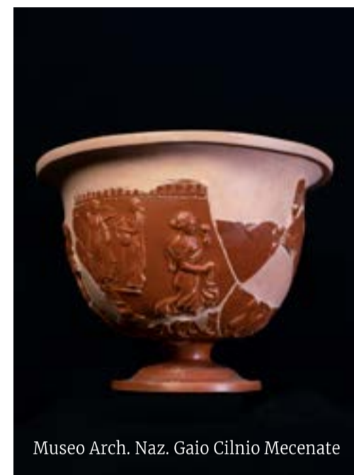
Museo Arch. Naz. Gaio Cilnio Mecenate

Tras la muerte del emperador Augusto en el año 14 d.C., su sobrino Agripa y su hijastro Tiberio se enfrentaron por su acceso al trono. Agripa fue acusado por la madre de Tiberio de homosexualidad, por lo que fue desterrado a Pianosa, donde más tarde fue asesinado. La villa de Agripa, Pianosa salió a la luz en el siglo XIX, junto con el teatro y las termas adyacentes. Los suelos están decorados con mosaicos en blanco y negro que representan escenas de la mitología marina. infoelba.it