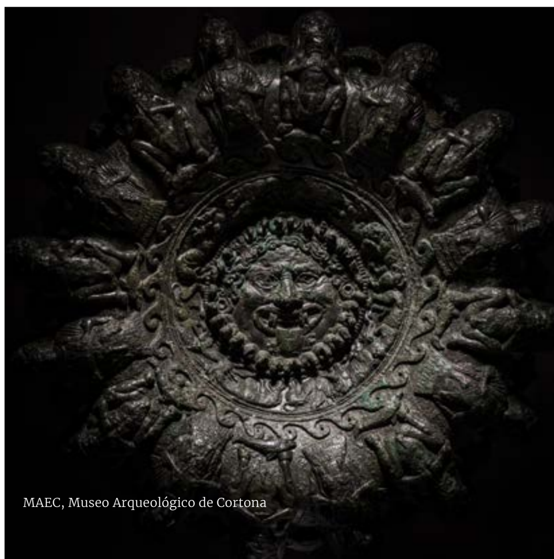
MAEC, Museo Archeológico de Cortona