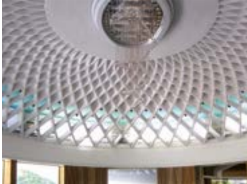
Museo Staccioni, Volterra

Es obra del diseñador Luigi Nervi (autor, en Toscana, también del teatro Politeama Pratese y del estadio municipal de Florencia); formada por elementos prefabricados de hierro y hormigón unidos por nervios, la cúpula hace gala de una elegante ligereza, que Nervi también utilizó en la sala de audiencias del Vaticano. eco.museisenesi.org