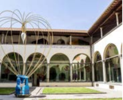
Museo Staccioni, Volterra

Museo Novecento, Florencia El Museo Novecento ofrece una selección de obras de las colecciones cívicas, que ilustran el arte italiano del siglo XX . Destaca especialmente la colección Alberto Della Ragione, con obras de Giorgio De Chirico, Filippo De Pisis, Gino Severini y otros. El museo organiza exposiciones temporales dedicadas a los grandes maestros del siglo XX y a artistas contemporáneos, en una comparación internacional de diferentes prácticas y generaciones. Conferencias y encuentros de carácter multidisciplinar completan la oferta del museo. El museo también organiza proyectos expositivos en diversos espacios de la ciudad, como el Forte di Belvedere, el Museo Stefano Bardini y Palazzo Vecchio. museonovecento.it