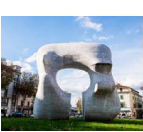
Museo Staccioni, Volterra

Una vez finalizada su restauración, la obra de Henry Moore, Forma squadrata con taglio (Forma cuadrada con corte), vuelve a estar a la vista del público en su totalidad. La obra se expuso en la plaza de San Marcos en 1974, tras la primera exposición monográfica italiana celebrada en Florencia en 1972. Formada por treinta bloques de mármol blanco de los Alpes Apuanos, tiene cinco metros de altura. Hoy forma parte del alma de Prato, pero fue muy criticada por un público aún poco acostumbrado a los lenguajes contemporáneos. La obra pretende hacer reflexionar sobre la relación entre el hombre, la naturaleza y la modernidad, tres elementos que se reflejan perfectamente en la plaza y en los montes de la Cavalcata, que destacan al fondo.