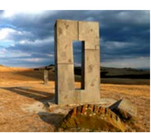
Museo Staccioni, Volterra

Esta obra «megalítica» se ha convertido en un lugar único de paso y encuentro entre artistas de diferentes disciplinas y horizontes.