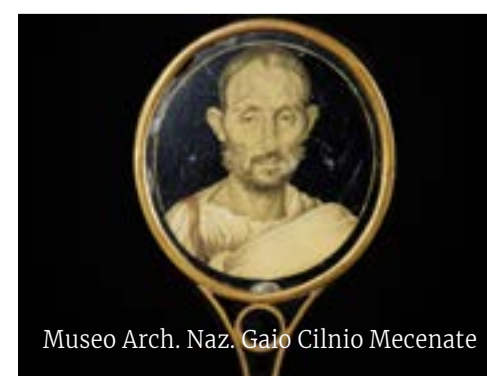
Museo Arch. Naz. Gaio Cilnio Mecenate

Nel cuore di Pisa si trovano le terme di Nerone, bagno romano del I secolo d. C. alimentato dall' acquedotto romano di Caldaccoli , del I sec. Il nome potrebbe far pensare al famoso imperatore romano, ma la costruzione delle terme iniziò circa una ventina d'anni dopo rispetto alla sua morte. Esso deriva dalla leggenda di San Torpè, ufficiale della corte di Nerone che, convertito al cristianesimo, venne arrestato e decapitato in questo luogo. Interessante è anche il museo navale, che ospita una bellissima collezione di navi romane. navidipisa.it