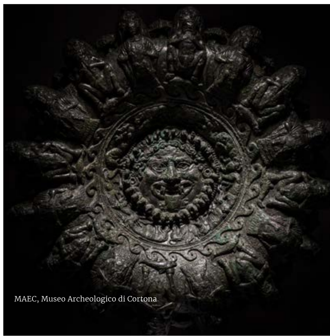
MAEC, Museo Archeologico di Cortona