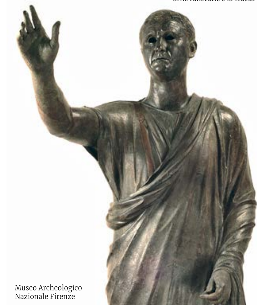
Museo Archeologico Nazionale Firenze

Il Museo documenta il popolamento che ha caratterizzato la zona del Monte Cetona dal paleolitico fino all'età del bronzo attraverso l'esposizione di reperti e ricostruzioni. Strettamente collegato al museo è il Parco Archeologico Naturalistico di Belverde , in cui è possibile visitare alcune delle cavità che si aprono nel travertino, adeguatamente illuminate e attrezzate quali la grotta di San Francesco, gli antri della Noce e del Poggetto. L' Archeodromo di Belverde , situato non lontano dall'omonima zona archeologica, è un