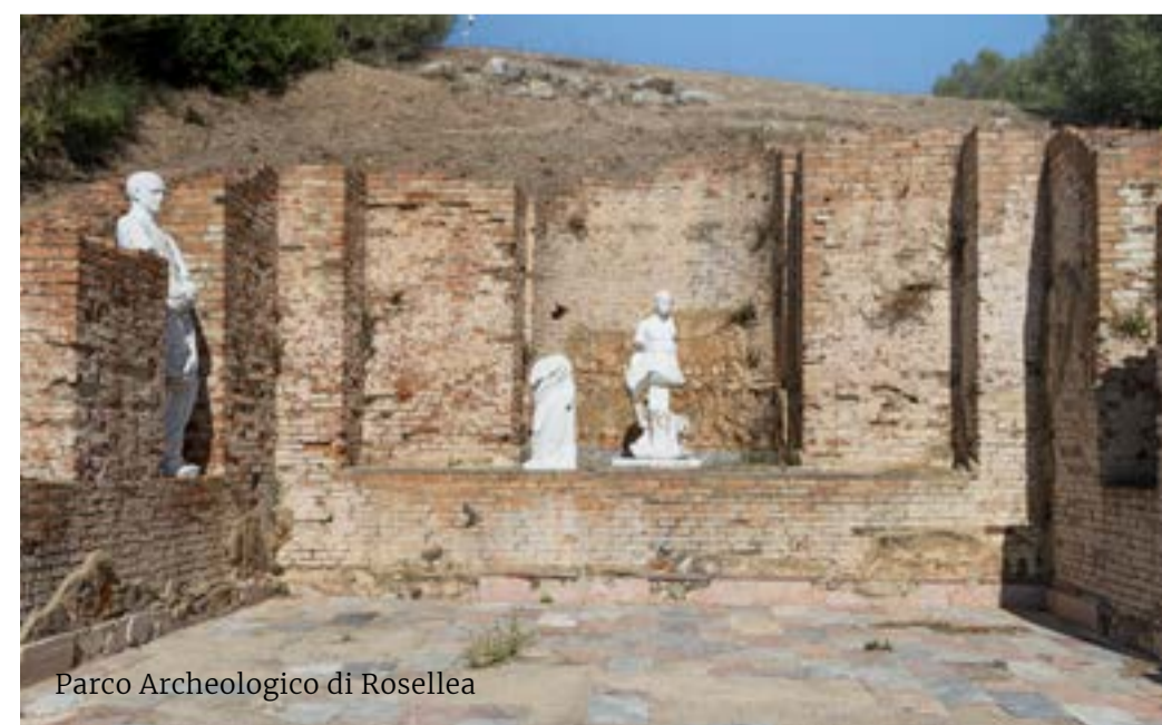
Parco Archeologico di Rosellea

Durante il I secolo d. C. la famiglia dell'imperatore Nerone era proprietaria delle isole dell'arcipelago toscano. Sull'Isola del Giglio e quella di Giannutri vennero costruite due ville residenziali. La prima si affacciava sul porto del Giglio. Nel IV secolo d. C. venne utilizzata come necropoli. La seconda cadde in disuso nel III secolo d. C. e rischiò di scomparire, ma grazie agli scavi archeologici portati avanti nell'Ottocento tornò alla luce e nel 2015 venne aperta al pubblico. museiarcipelago.it