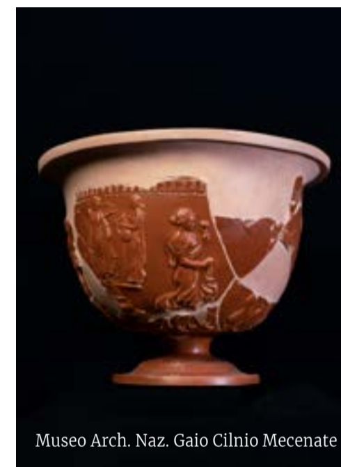
Museo Arch. Naz. Gaio Cilnio Mecenate

Dopo la morte dell'imperatore Augusto nel 14 d. C., il nipote Agrippa e il figliastro Tiberio si scontrarono per l'ascesa al trono. Agrippa venne accusato dalla madre di Tiberio di omosessualità e venne quindi esiliato a Pianosa, dove poi venne ucciso. La villa di Agrippa, a Pianosa , venne portata alla luce nell'Ottocento, insieme al teatro e ai bagni termali annessi. I pavimenti sono decorati con mosaici bianchi e neri, che raffigurano scene di mitologia marina. infoelba.it