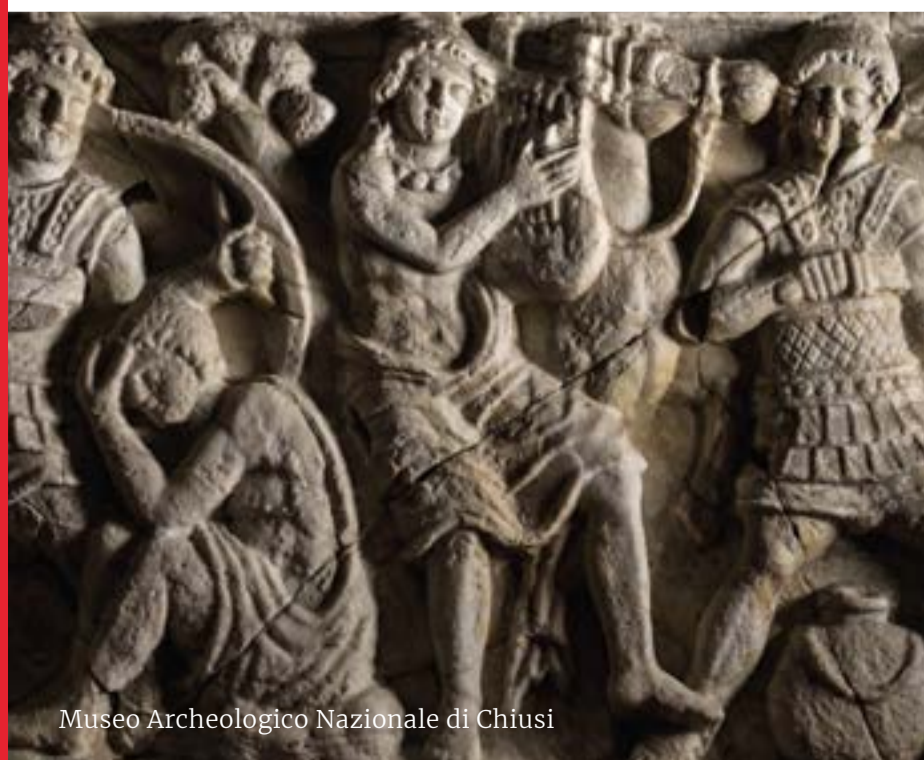
Museo Archeologico Nazionale di Chiusi

Eleganti e raffinati, curavano la mente ma anche il corpo con unguenti e attività fisica; avevano una religiosità fatta di superstizioni, che diventava una pratica quotidiana celebrata con maniacale attenzione per i dettagli. Dopo anni di florida civiltà il conflitto tra le città etrusche e Roma diviene inevitabile e, a partire dal V sec a.C, inizia il processo di romanizzazione dell'Etruria : dapprima in modo indolore, con la consegna spontanea di diverse città che passano nel raggio d'influenza della potente vicina, poi in misura più coercitiva, nel I sec. a.C., piegando anche le resistenze dei Galli alleati agli Etruschi. Se Roma impone il suo dominio nelle terre etrusche, altrettanto non può dirsi per la cultura, che rimase sempre venata dai preesistenti sostrati artistici e dai modelli, radicati nella popolazione, di indubbia origine etrusca.