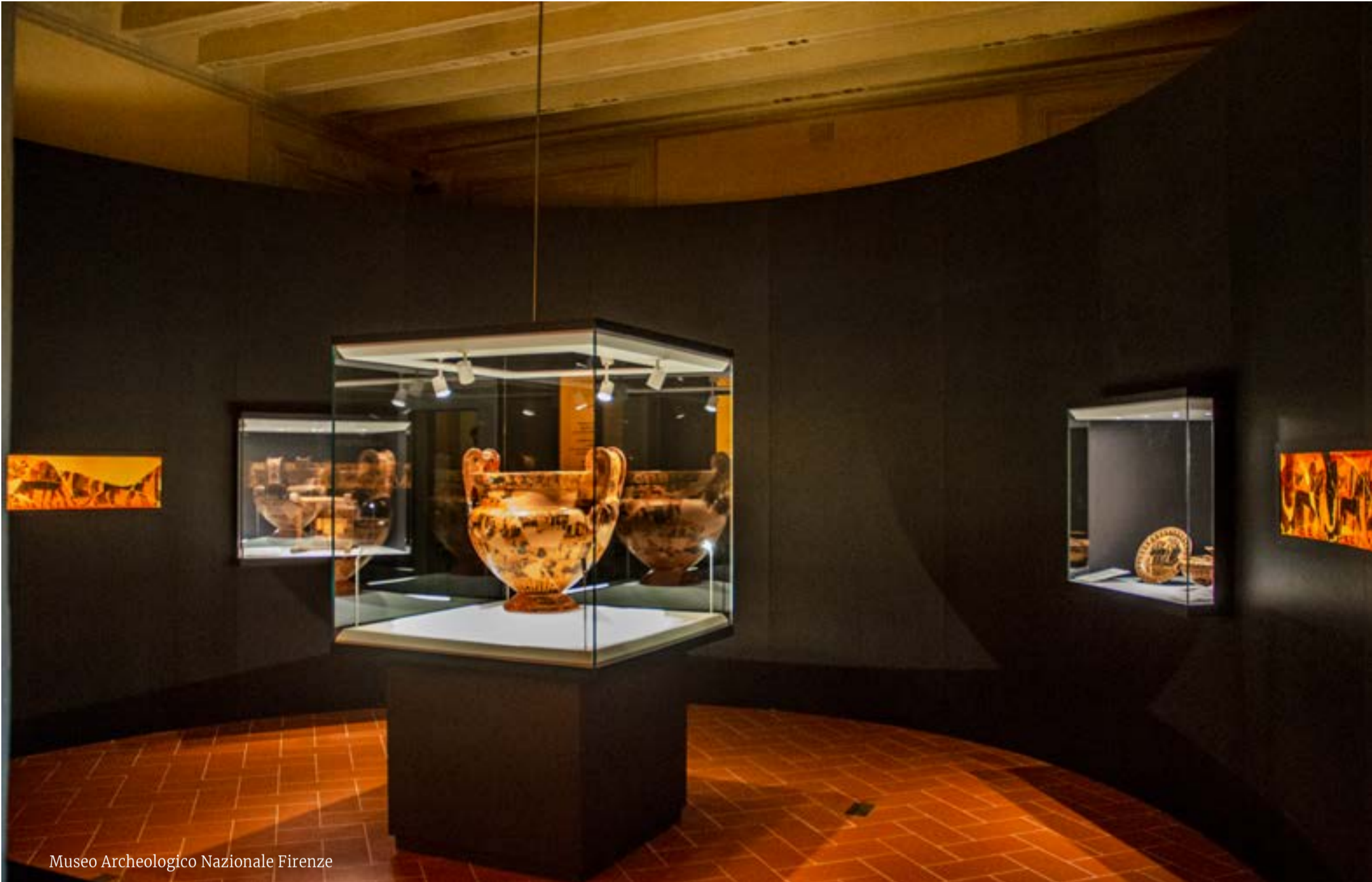
Museo Archeologico Nazionale Firenze