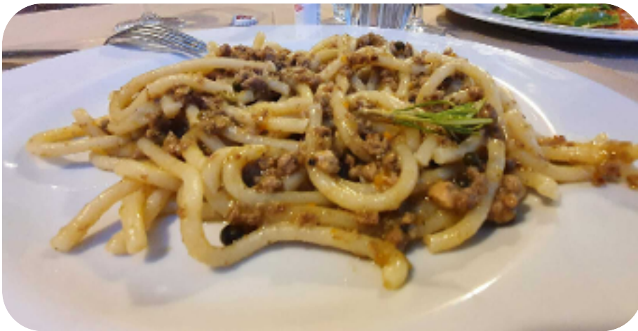
GLI IMMANCABILI PICI

Acquisteremo i nostri picnic nelle botteghe dei piccoli borghi per pranzare al sacco. Quando possibile pranzeremo in bar o locali tipici .